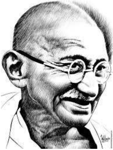
बिरला-भवन, नयी दिल्ली, 30-1-'48